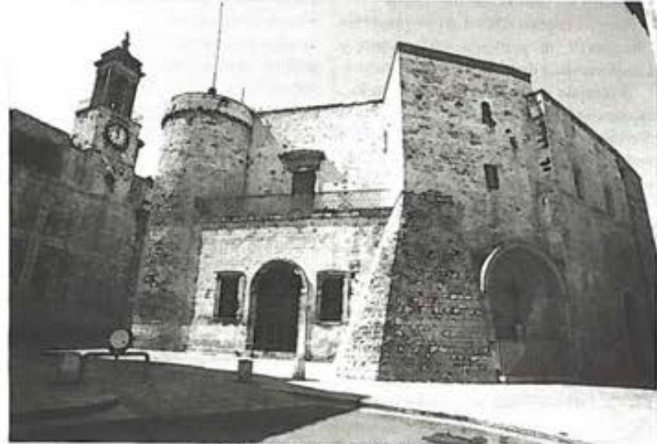
Nella foto: Il Castello di Bitritto

Nel nono secolo i Saraceni (un altro popolo arabo) dopo aver occupato la Sicilia presero man forte sull'altra parte meridionale della penisola. Questi invasero la zona del Borgo