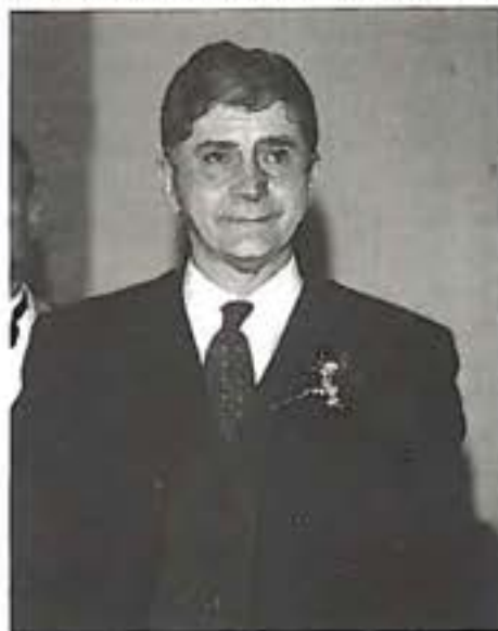
L'on. Rocco Buttiglione

Perché se è vero che molti di noi sono da tempo lontani dall'Italia, non è certo altrettanto vero che ce ne si sente separati nello spirito e nella volontà attiva di