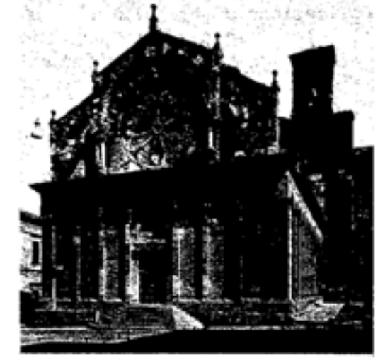
La famosa cattedrale di Troia del 1019

l'influsso dei loro usi, dei loro costumi e di tutta la loro civiltà: Greci, Romani, Bizantini, Arabi, Normanni, Svevi e Aragonesi. Boschi lussureggianti, agrumeti, lunghe distese di sabbia, e bellissime scogliere che scendono a strapiombo sul mare, conferiscono un aspetto suggestivo ed incantevole a questa terra.