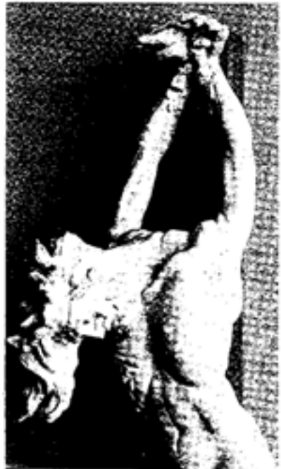
THE CHRIST 69. BRONZE. 39 x 7. 1969.

Domenico Mazzone, presentandoci una scultura che si concentra sulla figura umana, ha disturbato la nostra nozione dell'arte contemporanea come il cubismo, il post-impressionismo, l'astrattismo, etc., etc.. In questo secolo l'arte cubista, dopo aver esplorato la figura, l'ha abbandonata all'astrattismo. Mentre Mazzone, essendo un classico moderno molto forte, ci presenta delle forme umane originalissime, le quali incantano lo spettatore.