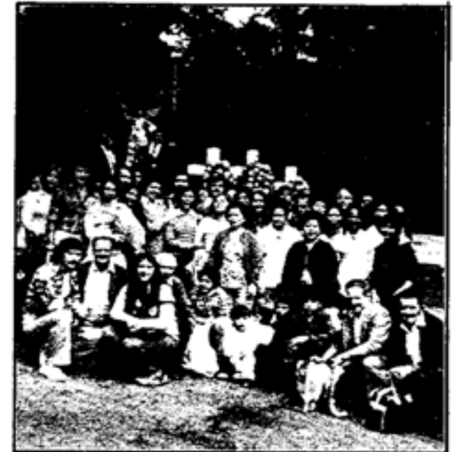
nella foto il gruppo dei partecipanti alla gita

La Direzione Sociale ora impegna nella costruzione del grandioso PRESSEPE, riprendera' le gite a febbraio. Quindi, arriveremo presto.