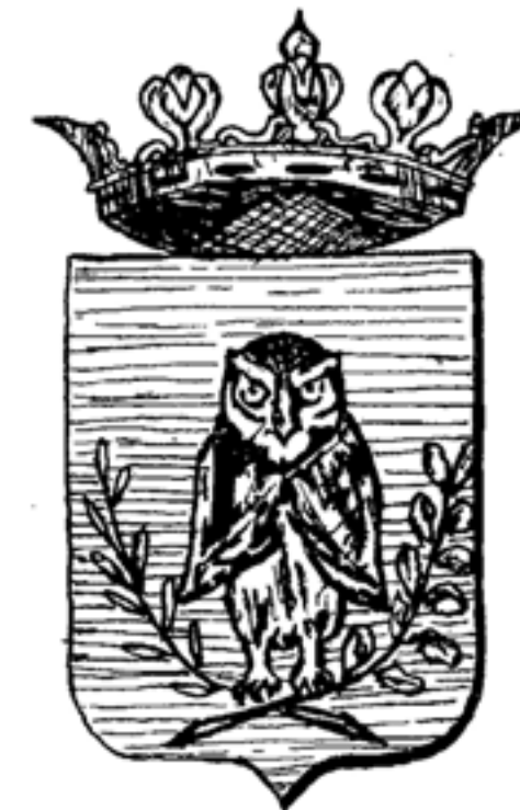
Il vecchio Stemma

ancora esattamente determinato, non lo si sa, per cui si fanno delle supposizioni piu' o meno veritiere. Tra le tante c'e' ne' una che potrebbe essere quella piu' vicina alla realta', e cioe' all'inizio del secolo scorso