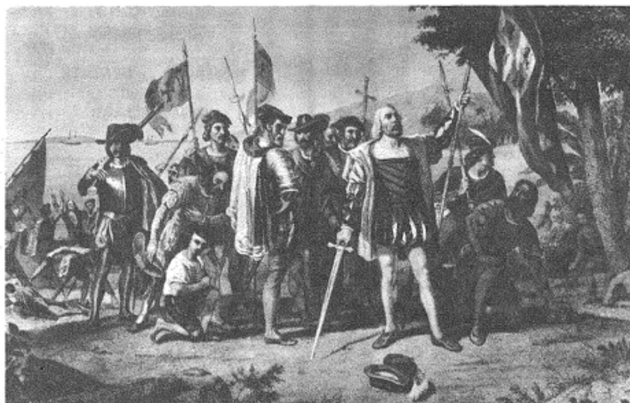
LO SBARCO DI CRISTOFORO COLOMBO

La scoperta del genovese C. Colombo nell'anno 1492, segnava l'inizio di una lunga serie di esplorazioni da parte di personaggi, molte volte al servizio di potenze straniere, con lo scopo di trovare nuove vie per raggiungere il nuovo mondo e naturalmente poi potere vantare dominio sulle terre scoperte. In cio' gli italiani eccelsero, come vedremo.