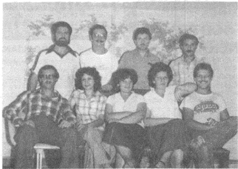
IL GRUPPO TEATRALE

IL CIRCOLO CULTURALE DI MOLA INVITA TUTTI I LETTORI DELL'IDEA A PARTECIPARE ALLA NOSTRA 2ª RAPPRESENTAZIONE TEATRALE CHE AVRA' LUOGO ALLA F.D.R. HIGH SCHOOL I GIORNI 13, 14 e 21 OTTOBRE.